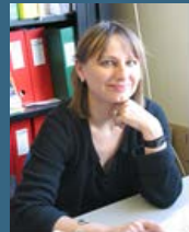
Pr Magali Remaud-Siméon INSA Toulouse

Les enzymes sont au cœur du vivant. Elles se positionnent aujourd'hui comme des auxiliaires précieux pour la transformation éclairée d'agro-ressources en molécules à haute valeur ajoutée dans le respect des règles de la chimie verte. Leur formidable puissance catalytique en conditions douces et leurs spécificités réactionnelles sont des atouts indéniables qui se trouvent aujourd'hui renforcés par l'accélération et les progrès des technologies de découverte et ingénierie des protéines. Exploiter le gigantesque vivier de séquences d'enzymes affluant chaque jour dans les banques de données, concevoir une enzyme à façon, la travailler pour en accroître ses performances, tout cela progresse à grands pas, et laisse entrevoir une forte extension du champ d'applications des procédés biocatalytiques. Après un bref état de l'art, l'exposé illustrera ces différents aspects à partir des réalisations de l'équipe catalyse et ingénierie moléculaire enzymatique du laboratoire d'Ingénierie des systèmes biologiques et procédés.